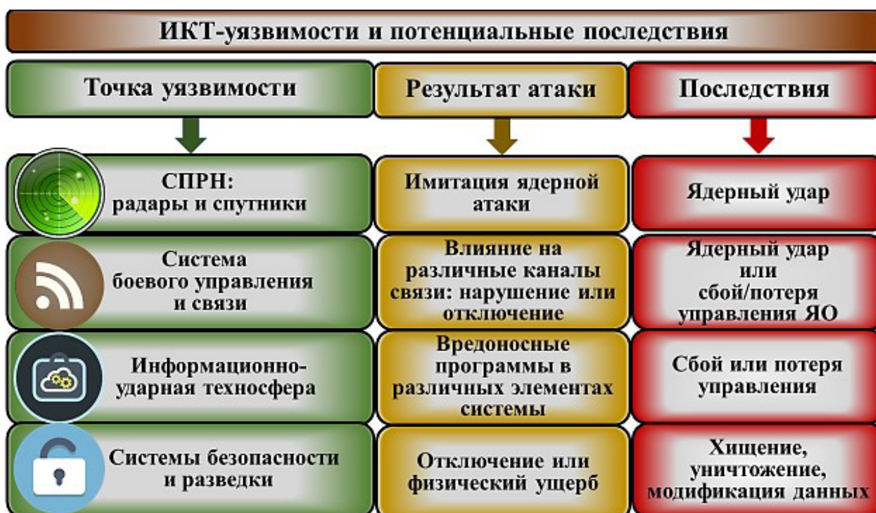
Рис. 1. Стратегические ядерные вооружения: некоторые ИКТ-уязвимости и потенциальные последствия

Сегодня уже более 30 стран обладают программным обеспечением (ПО) для нападения на объекты КИ. При этом показатель опасности для АСУ ТП в настоящее время оценивается специалистами как критический или высокий. В 2018 г. были зафиксированы ежемесячные кибератаки на каждый четвертый компьютер на про-